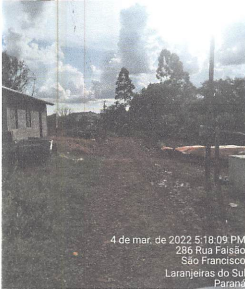
4 de mar. de 2022 5:18:09 PM 286 Rua Faisão São Francisco Laranjeiras do Sul Paraná