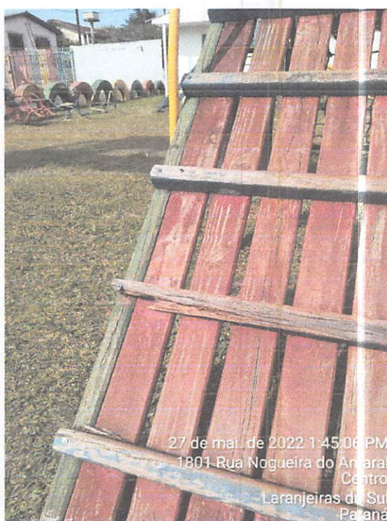
27 de mai. de 2022 1:45:06 PM 1801 Rua Nogueira do Amaral Centro Laranjeiras do Sul Paraná