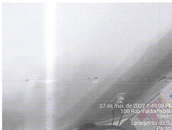
27 de mai. de 2022 1:49:09 PM 100 Rua Valdomiro Be Centro Laranjeiras do Sul Paraná

Fone/Fax: (42) 3635-6861 – (42) 3635-4308