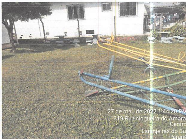
27 de mai. de 2022 1:44:20 PM 1819 Rua Nogueira do Amaral Centro Laranjeiras do Sul Paraná