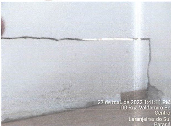
27 de mai. de 2022 1:41:11 PM 100 Rua Valdomiro Be Centro Laranjeiras do Sul Paraná