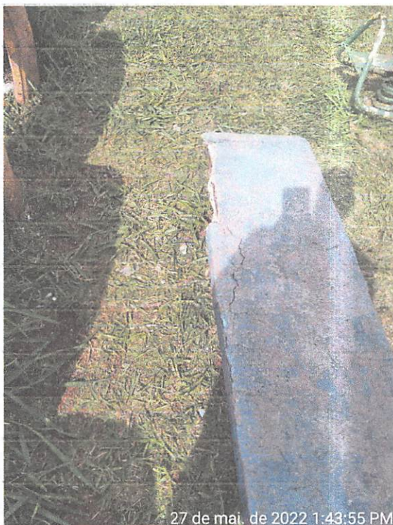
27 de mai. de 2022 1:43:55 PM