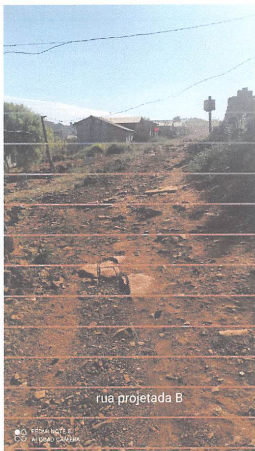
rua projetada B