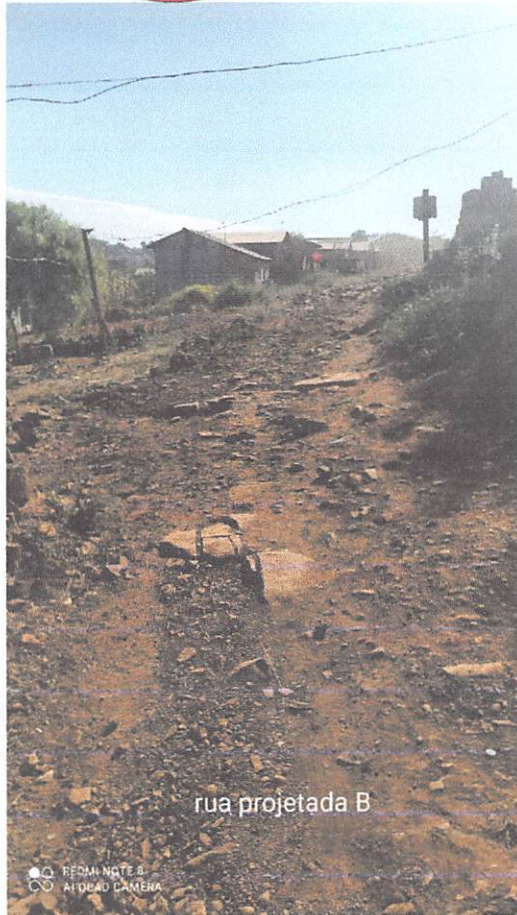
rua projetada B